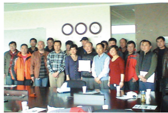
□连续五年无事故车队受到用户的表彰与奖励。

本刊讯 中远大昌汽车租赁有限公司康菲石油车队为外资企业服务五年无事故，其服务方康菲石油领导和主管部门也非常重视驾驶员的安全管理与培训，精灵时创培训部每次来培训，都提前准备好会议室、投影仪并组织济南、秦皇岛等地驾驶员共同进行视频培训，使驾驶员的服务素质不断提高，多次受到外方老板的表扬。(海英)